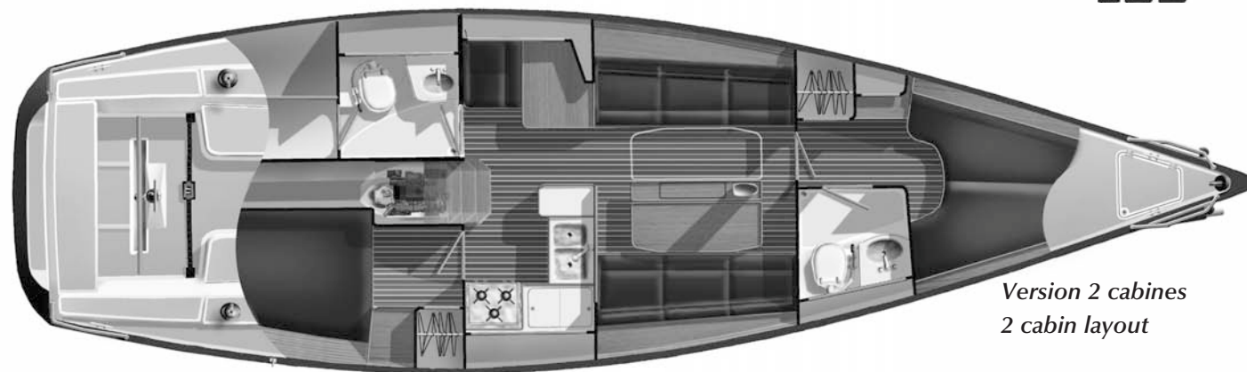
Version 2 cabines 2 cabin layout